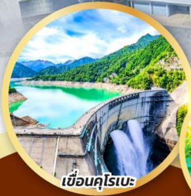
เขื่อนคุโรเบะ