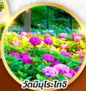
วัดมิมุโระโทจิ