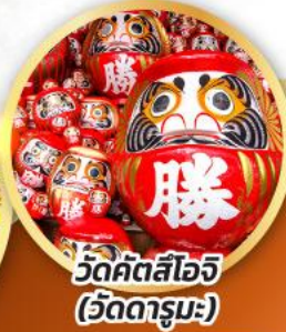
วัดคัตสึโฮจิ (วัดदारุมะ)

ชมความงามของกำแพงหิมะ เส้นทางสายอัลไพน์ ทากายามา (JAPAN ALPS SNOW WALL)