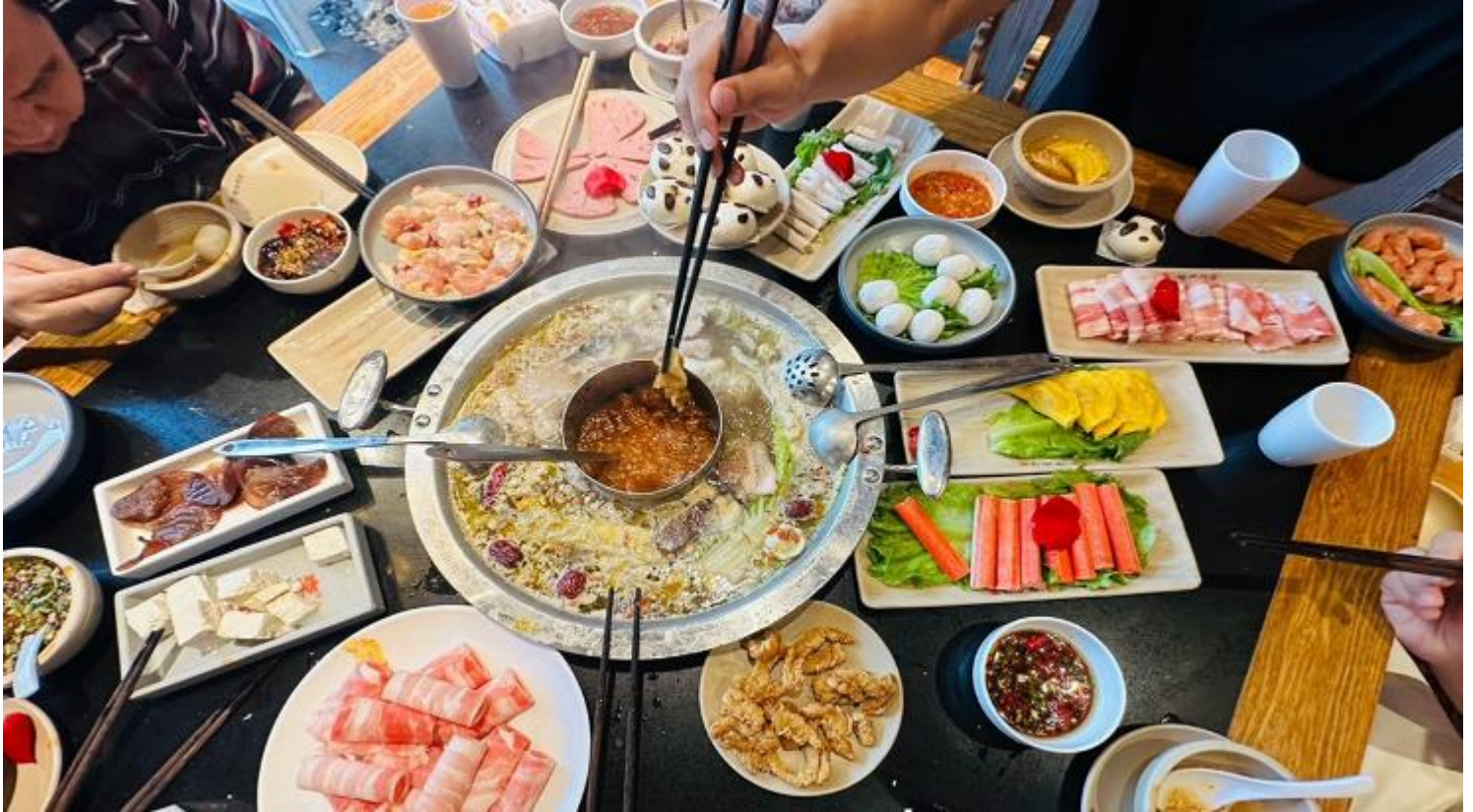
คำ รับประทานอาหารคำ ณ ภัตตาคาร (เมื่อที่ 12) *เมนูพิเศษสุกี้หมอลำเสวน

จากนั้นนำท่านเดินเล่นชม สตรีทอาร์ต Eastern Suburb Memory หรือตงเจียวจีอี เดิมเป็นโรงงานเก่า ปรับเป็นแหล่งท่องเที่ยว จุดเช็คอินเดินเล่นชิลๆ ที่ทั้งร้านของกินเครื่องดื่ม ร้านกาแฟ ร้านเสื้อผ้า ร้านนั่งชิล เป็นแหล่งรวมร้านค้าของเก๋ๆและมุมถ่ายภาพน่ารักๆมากมาย และอีกหนึ่งไฮไลท์เมื่อมาถึงที่นี่ต้องถ่ายภาพกับกำแพงอิฐสีส้มที่เขียนว่า 成都 Chengdu เป็นจุดถ่ายรูปยอดนิยมของวัยรุ่นเฉิงตูอีกด้วย นอกจากนี้ในบางวันยังมีการแสดงดนตรีต่างๆ และในแต่ละช่วงของปีก็จะมีการจัดนิทรรศการแสดงผลงานศิลปะแตกต่างกันไปในแต่ละเดือนให้ได้ชมอยู่เรื่อยๆ