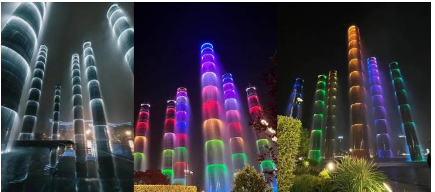
2UTFU-VZ003 เฉิงตู อุทยานสัตว์รณี อุทยานปีผิงโกว อุทยานจิวจ้ายโกว (นั่งรถไฟความเร็วสูง) 6วัน 5คืน โดยสายการบิน Thai VietJet Air (VZ)