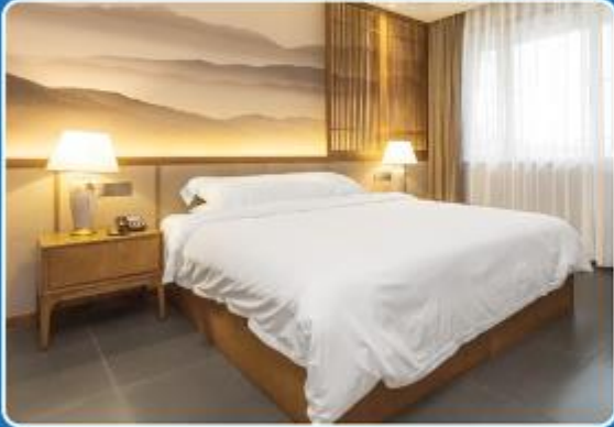
👤 SINGLE (SGL)