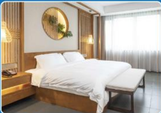
👤👤 DOUBLE (DBL)