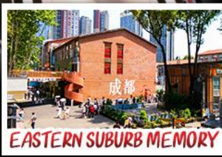
EASTERN SUBURB MEMORY