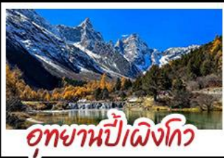
อุทยานป่าเผิงโกว

อุทยานสี่ดรุณี - อุทยานป่าเผิงโกว - อุทยานจิวจ้ายโกว รถไฟความเร็วสูง - EASTERN SUBURB MEMORY ถนนโบราณความจำย - วัดต้าฉือ ช้อปปิ้งย่านคิง ถนนไท่กู๋หลี่ + ถนนชุนซีลู่