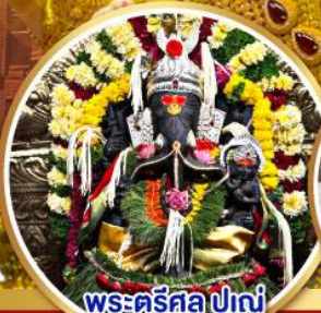
พระศรีศิว ปูเณ (Trishul Pune)