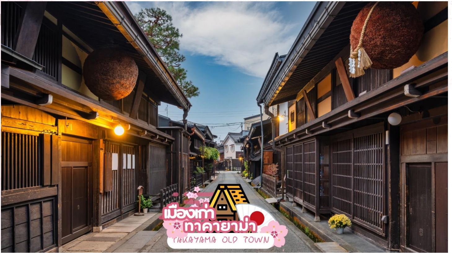
เมืองเก่า ทาคายามา TAKAYAMA OLD TOWN

สะพานนากะบาชิ (Nakabashi Bridge) สะพานสีแดงของย่านเมืองเก่า สะพานทอดข้ามแม่น้ำมิกากา วะที่ไหลผ่านใจกลางเมือง สะพานแห่งนี้ถือเป็นสัญลักษณ์ของเมืองทาคายามา (ซากุระขึ้นอยู่กับ สภาพอากาศ)