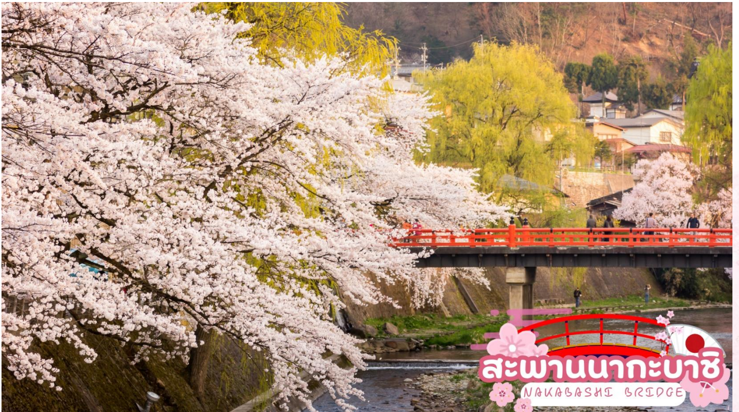
สะพานนากะบาชิ NAKABASHI BRIDGE

สะพานนากะบาชิ (Nakabashi Bridge) สะพานสีแดงของย่านเมืองเก่า สะพานทอดข้ามแม่น้ำมิกากา วะที่ไหลผ่านใจกลางเมือง สะพานแห่งนี้ถือเป็นสัญลักษณ์ของเมืองทาคายามา (ซากุระขึ้นอยู่กับ สภาพอากาศ)