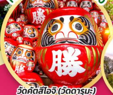
วัดคัตสึโงจิ (วัดดาร์มูมะ)