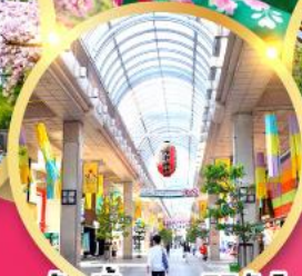
ช้อปปิ้ง ถนนอิชิบังโจ