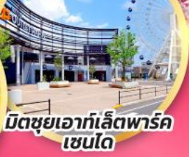
มิตซูเอากะไลท์พาร์ค เซนได