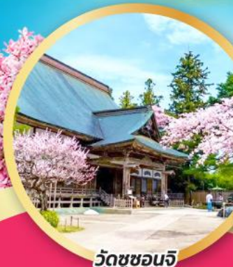
วัดชูซอนจิ