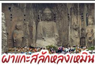
ถ้ำหลงเหมิน

เที่ยวครบ 4 มรดกโลก ถ้ำหลงเหมิน - สุสานฉินซีอังกเต๋ - วัดเส้าหลิน หมู่บ้านไต้คินसानโจว - หมู่บ้านกัวเลียงซุน