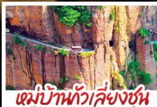
หมู่บ้านกัวเลียงซุน