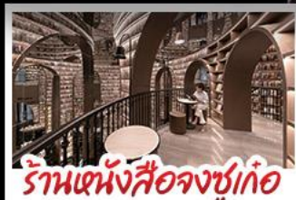
ร้านหนังสือจูกูเกอ

อุทยานกุส่าสือครุณี อุทยานป่าเชิงทิว หมีแพนด้าแอนเซลฟี ร้านหนังสือจูกูเกอ วัดต้าฉือ ถนนโบราณความจำ ซอปปิงย่านคิง ถนนไท่กู่หลี่ + ถนนซุนซู่ เมนูพิเศษ สุกี้หมาล่าเสวณ