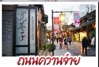
ถนนความจำ