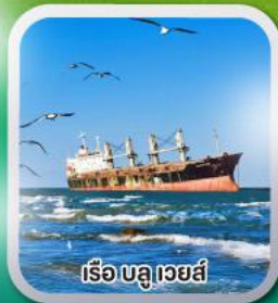
เรือบลูเวย์ส