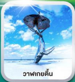
วาฬเกยตื้น