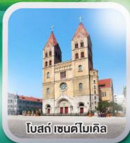
โบสถ์ เซนต์ไมเคิล