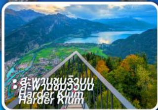
• สะพานซันวิงบูน Harder Klamm Harder Klamm