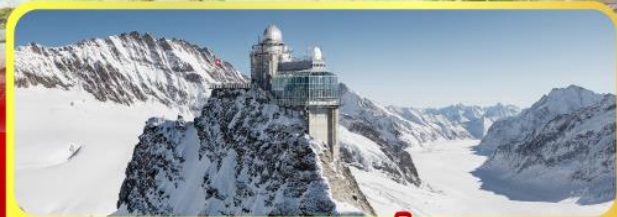
ยอดเทวจุงเฟรา