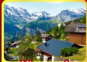
หมู่บ้านเมอร์เสน