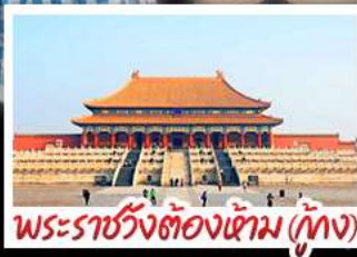
พระราชวังต้องห้าม (กุ๊กง)