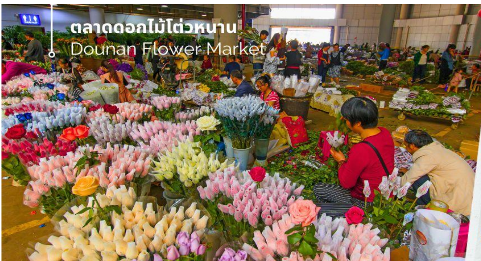
ตลาดดอกไม้ไต้หวัน Dounan Flower Market