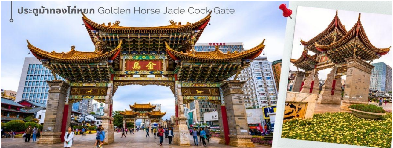
ประตูม้าทองไก่อหยก Golden Horse Jade Cock Gate

ชม ชุ้มประตูม้าทอง และ ชุ้มประตูไก่อหยก ซึ่งภาษาจีนเรียกว่าจินหม่า และปี้จี จึงเอาคำย่อ จีนปี้ มาขนานนามถนนแห่งนี้ ชุ้มม้าทองและไก่อหยก มีอายุร่วม 400 ปี สร้างขึ้นในสมัยราชวงศ์หมิง ในถนนย่านการค้าแห่งนี้ เป็นแหล่งเสื้อผ้าแบรนด์เนมทั้งของจีนและต่างประเทศ รวมทั้งเครื่องประดับ อัญมณี ร้านเครื่องดื่ม และร้านขายของที่ระลึกมากมาย