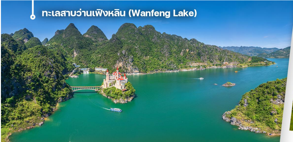
ทะเลสาบวานเฟิงหลิน (Wanfeng Lake)