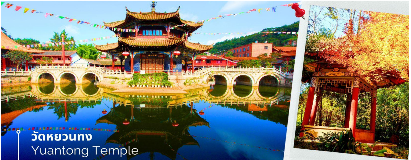
วัดหยวนทง Yuantong Temple

เพราะปกติแล้วการสร้างวัดของจีนส่วนมากจะต้องสร้างอยู่บนภูเขา แต่วัดหยวนทงสร้างวัดต่ำกว่าภูเขา โดยวิหารจะอยู่ต่ำที่สุด เนื่องจากวัดแห่งนี้ไม่ได้สร้างขึ้นเพื่อเป็นวัดโดยตรง แต่เคยเป็นศาลเจ้าแม่กวนอิมมาก่อน