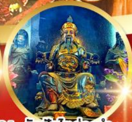
วัดปึกโต้อึ้งอ่า