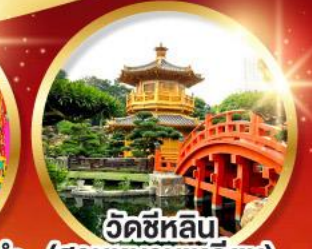
วัดซีหลิน (สวนหนานหนานเหลียน)