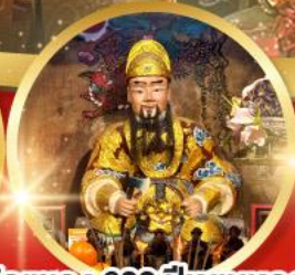
วัดเซกง 600 ปีหยุนหลอง