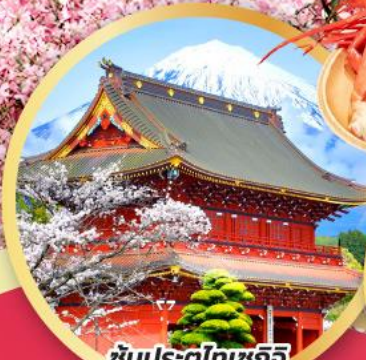
ชมประตูโทเซกจิ แซมมอน วัดโทเซกจิ