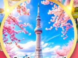
โตเกียวสกายทรี ริมแม่น้ำสุมิเดะ ซากุระ