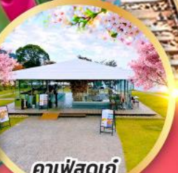
คาเฟ่สุดเก๋ ACAO FOREST

ถ่ายรูปเช็คอินวิวฟูจิ กับชมประตูโทเซกจิ แซมมอน วัดโทเซกจิ ชมซากุระรอบทะเลสาบคาวากุจิโกะ ชมซากุระพร้อมวิวทะเลในคาเฟ่สุดเก๋ ACAO FOREST