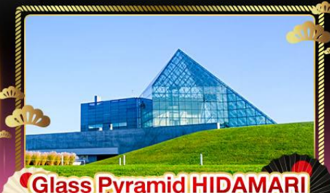
Glass Pyramid HIDAMARI