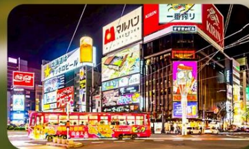
ซูปปิ้งย่านซูซุกิโนะ