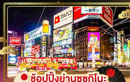
ช้อปปิ้งย่านซุกุชิโนะ