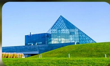
Glass Pyramid HIDAMARI