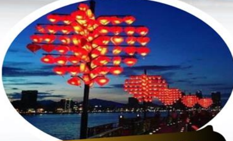
สะพานแห่งความรัก