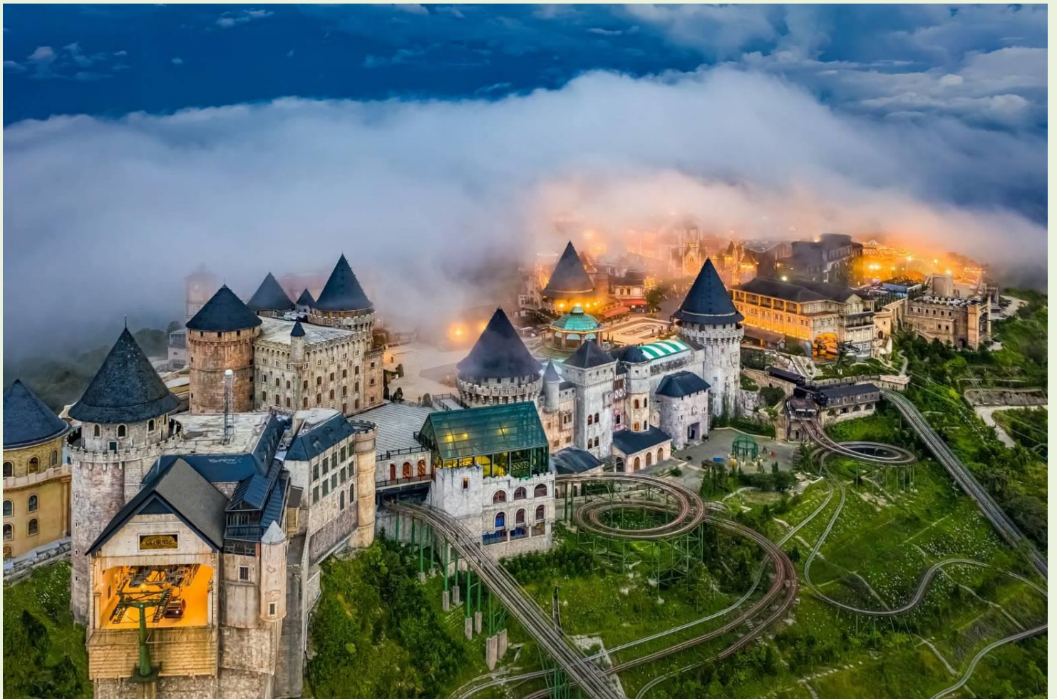
2UDAD-EK005 หลงเสน่ห์ เวียดนามกลาง ดานัง ฮอยอัน พั๊กบานาฮิลล์ 1 คืน (ไม่ลงร้านช้อปปิ้ง) 3 วัน 2 คืน โดยสายการบิน Emirates Airlines (EK)