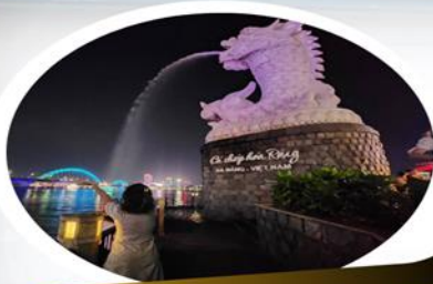
Dragon Carp Statue