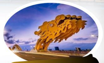
สะพานมังกร (Dragon Bridge)

นำท่านชม สวน APEC มุมถ่ายรูปสุดชิคที่ไม่ควรพลาดในดานัง ตั้งอยู่ริมฝั่งแม่น้ำฮาน ใกล้ๆ สะพานมังกร เมืองดานังนั่นเอง ซึ่งประเทศเวียดนามสร้างไว้เพื่อต้อนรับการประชุม APEC ที่ประเทศเวียดนามในปี 2017 โดยมีจุดเด่นคือเป็นโดมขนาดยักษ์ ที่สร้างมาจากเหล็ก 200 ตัน รูปทรงมีลักษณะเหมือน 'วาวยักษ์' ซึ่งใหญ่จริง และทาสีขาวได้อย่างลงตัว ถ่ายรูปออกมาสวยชิคทุกมุม