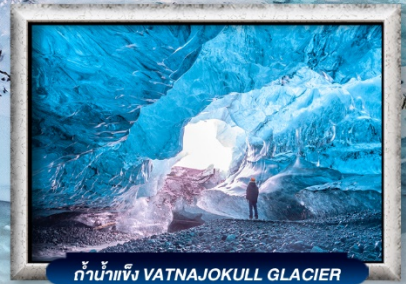
ถ้ำน้ำแข็ง VATNAJOKULL GLACIER

บินทรู สายการบิน Full Service | พิเศษ! ทานอาหารโดมกระจกิว 360 องศา