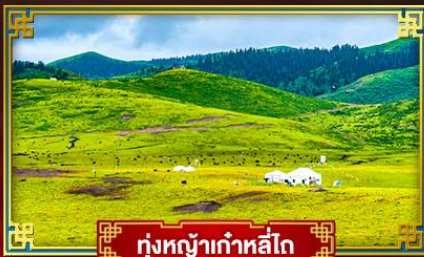
ทุ่งหญ้าท่าหลี่โต