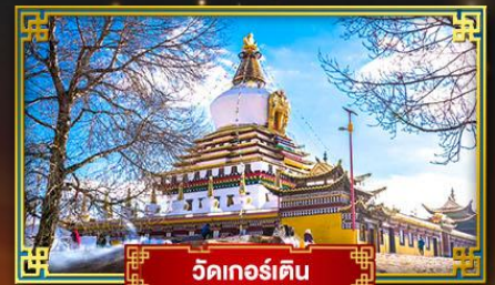
วัดเกอ์เติน