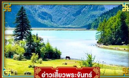
อ่าวสีขาวพระจันทร์