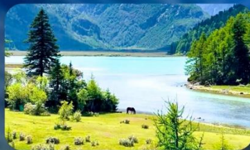
อ่าวเสี้ยวพระจันทร์