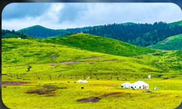
ทุ่งหญ้าเก้าหลี่ไถ