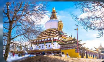
วัดเกอร์เติน