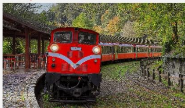
อุทยานแห่งชาติอาลีซาน