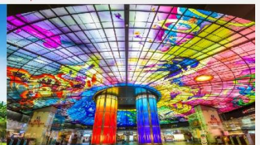
Dome of Light

*ทางบริษัทฯ ขอสงวนสิทธิ์ในการสลับโปรแกรมทัวร์ตามความเหมาะสมขึ้นอยู่กับสถานการณ์หน้างาน โดยคำนึงถึงผลประโยชน์ของลูกค้าเป็นสำคัญ