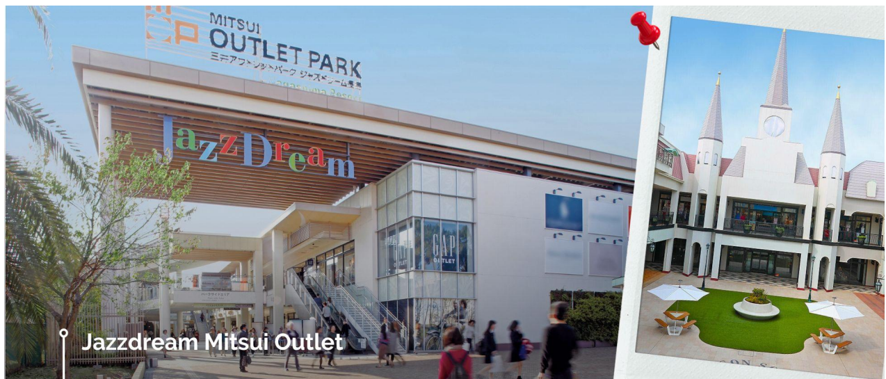
Jazzdream Mitsui Outlet

นำท่านเดินทางสู่ จังหวัดมิเอะ (ใช้เวลาเดินทางประมาณ 1 ชั่วโมง 40 นาที) Jazzdream Mitsui Outlet ซึ่งเป็น Outlet ที่มีร้านค้าต่างๆมากที่สุดในญี่ปุ่น โดยสินค้าที่นี้จะจำหน่ายในราคาลด 30% – 70% จากราคาปกติ มีศูนย์อาหารและลานกิจกรรมคล้ายเป็นฮิมพาร์คแห่งหนึ่ง โดยให้ท่านได้อิสระช้อปปิ้งสินค้า ของฝาก ของที่ระลึก