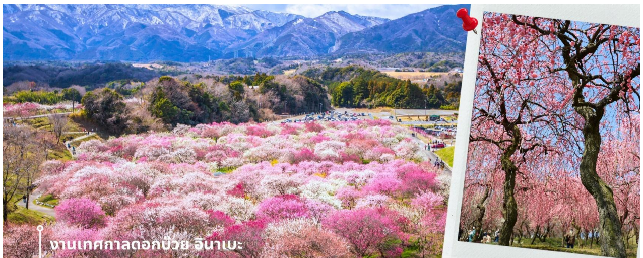
งานเทศกาลดอกบ๊วย อินาเบะ

หลังรับประทานอาหารเช้า พาท่านเดินทางสู่จังหวัดมิเอะ พาท่านชม เทศกาลดอกบ๊วยอินาเบะ ตั้งอยู่ในเมืองอินาเบะ จัดขึ้นเป็นประจำทุกปีในช่วงฤดูใบไม้ผลิ ที่ สวนบ๊วยอินาเบะ เป็นหนึ่งในสวนบ๊วยที่ใหญ่ที่สุดของญี่ปุ่น ครอบคลุมพื้นที่กว่า 38 เฮกตาร์ ภายในปลูกต้นบ๊วยมากกว่า 4,000 ต้น จากกว่า 100 สายพันธุ์ ที่บานสะพรั่งเรียงรายเป็นทะเลสีชมพู