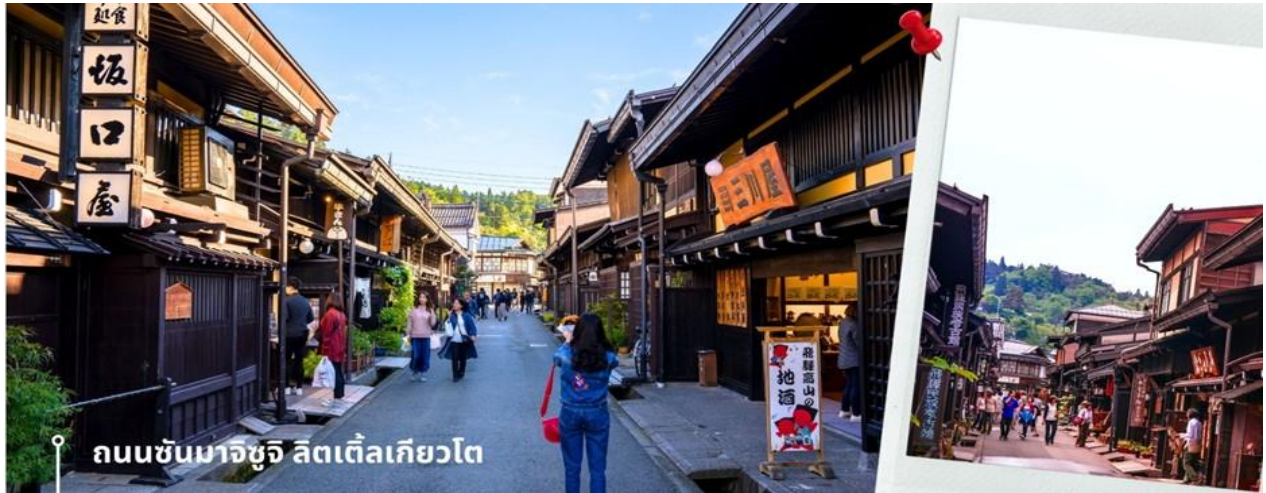
ถนนซันมาจิซุจิ ลิตเติ้ลเกียวโต

หลังรับประทานอาหารเช้าที่ท่านเดินทางสู่ เมืองทาคายามา ซึ่งเป็นเมืองเล็กๆ ที่ตั้งอยู่ในจังหวัดกิฟุ ที่ห้อมล้อมไปด้วยภูเขาและธารน้ำใส ให้เวลาท่านเดินเล่นสัมผัสบรรยากาศสวยงามที่ ถนนซันมาจิซุจิ ซึ่งถูกขนานนามว่าเป็น “ลิตเติ้ลเกียวโต” บ้านไม้โบราณโทนสีน้ำตาลดำ เรียงรายไปตามทางเดิน มีคูน้ำอยู่รอบเมือง ต้นไม้ร่มรื่นอยู่เป็นระยะ ปัจจุบันได้มีการปรับเปลี่ยนเป็นร้านค้า ร้านอาหาร ของที่ระลึก สำหรับนักท่องเที่ยวให้ได้เลือกชม เลือกซื้อ