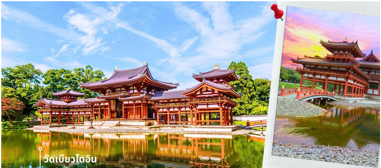
วัดเบียวโดอิน

หลังจากนั้น พาท่านไปยัง วัดเบียวโดอิน ตั้งอยู่ในเมืองอูจิ จังหวัดเกียวโต สร้างขึ้นตั้งแต่สมัยเฮอันในปี ค.ศ. 1052 เป็นวัดที่ได้รับคัดเลือกจากยูเนสโกให้เป็นหนึ่งในมรดกโลกของญี่ปุ่น และไฮไลท์หลักของวัดเบียวโดอินแห่งนี้ก็คือ Amida-do Hall หรือ Phoenix Hall วิหารไม้สีแดงสดที่ตั้งอยู่ตรงกลางของวัด ซึ่งตัววิหารเป็นโครงสร้างดั้งเดิมที่สร้างตั้งแต่อดีต มีจุดเด่นคือด้านบนตรงมุมของหลังคามีรูปปั้นนกโฮโอ หรือที่รู้จักกันในชื่อ นกฟีนิกซ์ สองตัวตั้งอยู่ และตัววิหารยังถูกล้อมรอบด้วยบึงน้ำใสที่ข้างล่างเต็มไปด้วยปลาคราฟตัวใหญ่ ทำให้รู้สึกเสมือนว่าวิหารแห่งนี้กำลังลอยอยู่บนน้ำ และวิหารแห่งนี้ คือวิหารเดียวกันกับที่อยู่บนเหรียญสิบเยนของญี่ปุ่นอีกด้วย