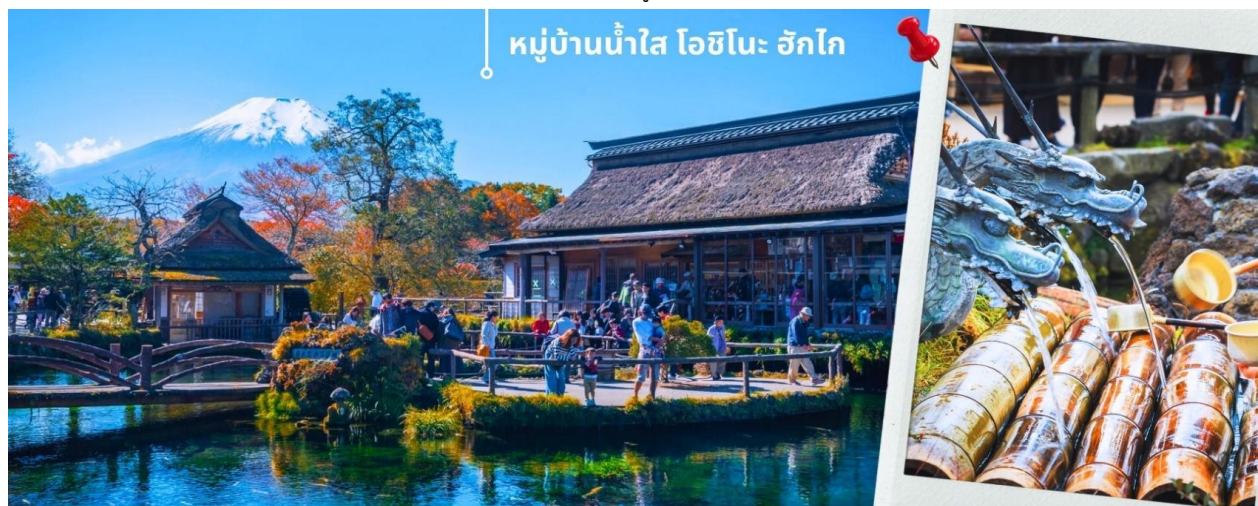
หมู่บ้านน้ำใส โอชิโนะ ฮักโกะ

จากนั้นนำท่านเดินทางสู่ หมู่บ้านน้ำใส โอชิโนะ ฮักโกะ (Oshino hakkai) ถือเป็นหมู่บ้านแห่งการท่องเที่ยวที่ยังคงความอุดมสมบูรณ์ของธรรมชาติเอาไว้ได้อย่างดีในหมู่บ้านมีบ่อน้ำใสที่เป็นน้ำที่ละลายมาจากหิมะบนภูเขาไฟฟูจิ ที่นี่มีความสวยงามในระดับที่ว่าได้รับการขึ้นทะเบียนให้เป็นมรดกทางธรรมชาติ ในปี ค.ศ. 1934 และได้รับคัดเลือกให้เป็นหนึ่งในภูมิทัศน์ทางน้ำที่งดงามในปี ค.ศ. 1985 อีกด้วย ไฮไลต์ในช่วงฤดูใบไม้ร่วง หรือช่วงใบไม้เปลี่ยนสีอีกอย่างหนึ่งก็คือ เราจะสามารถเห็นบรรยากาศหมู่บ้านที่ประกอบไปด้วยใบไม้สีแดง เหลือง ทว่าบริเวณ ให้ความสวยงามไปอีกแบบและยังเป็นอีกหนึ่งสถานที่ที่เราสามารถมองเห็นวิวฟูจิ หากวันนั้นเป็นวันที่ฟ้าเปิด