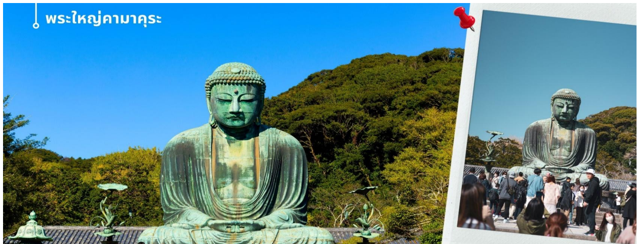
พระใหญ่คามาคุระ

หลังรับประทานอาหารเช้า เดินทางสู่ เมืองคามาคุระ (ใช้เวลาเดินทางประมาณ 1 ชั่วโมง 50 นาที) พาท่านเข้าชม พระใหญ่คามาคุระ (Kamakura Daibutsu หรือ The Great Buddha) เป็นพระพุทธรูปที่สำคัญที่สุดในเมืองคามาคุระ ตั้งอยู่ในวัดโคโตะกุอิน (Kotokuin Temple) พระพุทธรูปโตบุตสึมีความสูงถึง 13.35 เมตร น้ำหนัก 95 ตัน เป็นพระพุทธรูปที่ใหญ่เป็นอันดับสองในญี่ปุ่น รองจากหลวงพ่อดโต แห่งวัดโทไดจิ เมืองนารา จากหลักฐานพบว่าพระใหญ่โตบุตสึสร้างขึ้นในปี ค.ศ.1252 ในตอนแรกนั้นพระพุทธรูปอยู่ในห้องโถงของวัด แต่ตัววัดได้รับความเสียหายจากพายุและแผ่นดินไหว อยู่หลายครั้ง จนในที่สุดไม่มีตัวอาคารของวัด พระใหญ่โตบุตสึจึงได้ตั้งอยู่กลางแจ้ง รับชมความงามของใบไม้เปลี่ยนสีฤดูใบไม้ร่วงภายในวัด