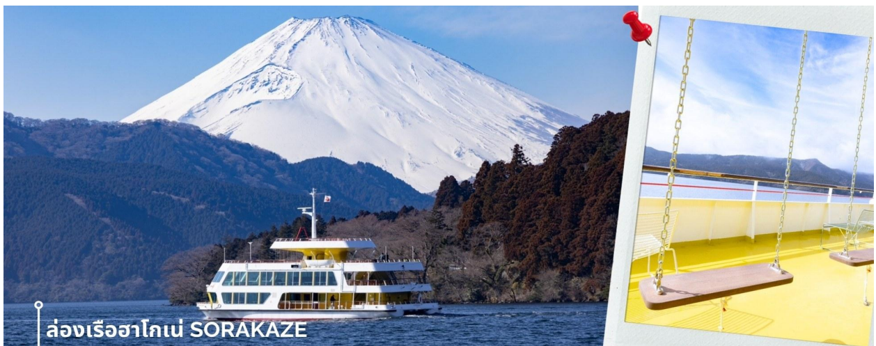
ล่องเรือฮาโกเน่ SORAKAZE

หลังรับประทานอาหารเช้า พาท่านเดินทางสู่ ทะเลสาบอาชิ ซึ่งเป็นทะเลสาบที่ล้อมรอบไปด้วยธรรมชาติที่อุดมสมบูรณ์และวิวภูเขาฟูจิ เป็นหนึ่งในทะเลสาบที่สวยงามที่สุดในญี่ปุ่น ในประวัติศาสตร์เชื่อกันว่าทะเลสาบแห่งนี้เกิดขึ้นจากการปะทุของภูเขาไฟเมื่อประมาณ 3100 ปีก่อน ปัจจุบันเป็นแหล่งท่องเที่ยวในฮาโกเน่ พาท่าน ล่องเรือฮาโกเน่