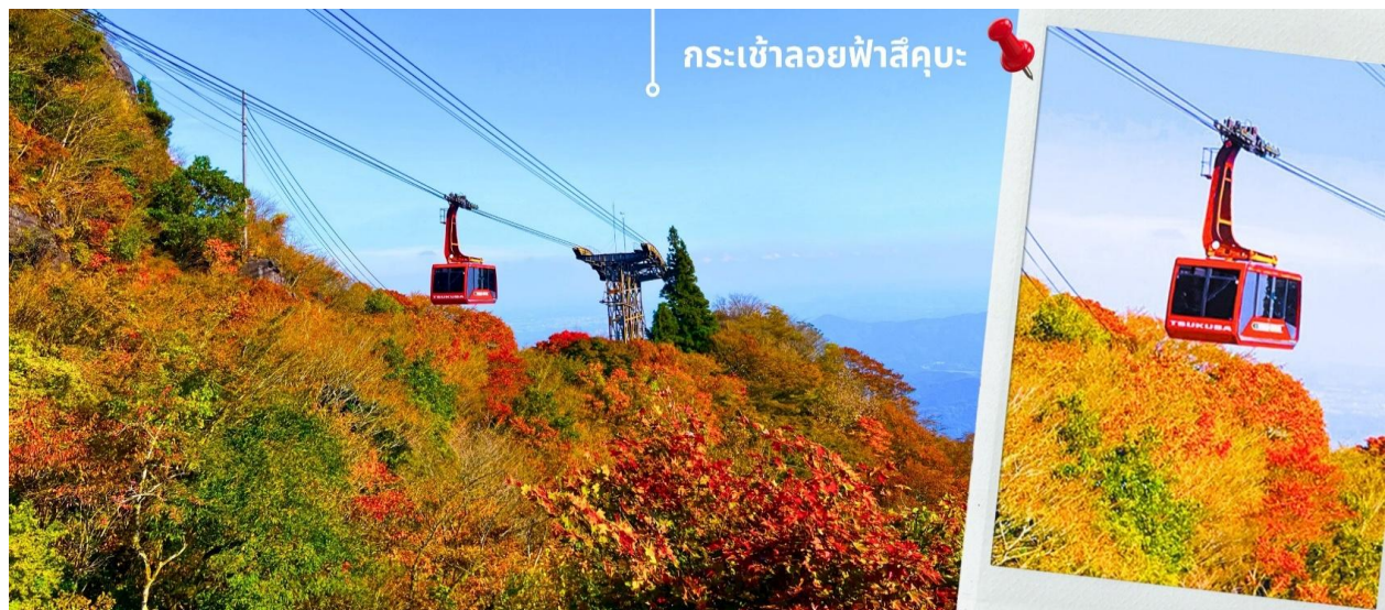
กระเช้าลอยฟ้าสึคุบะ

เที่ยง รับประทานอาหารเที่ยง ณ ภัตตาคาร เมนูพิเศษ!! ซาซุเซ็ต สไตส์ญี่ปุ่น (2) หลังรับประทานอาหารเที่ยง นำท่านเดินทางสู่ จังหวัด อิบารากิ (Ibaraki) (ใช้เวลาเดินทางประมาณ 1 ชั่วโมง 10 นาที) เพื่อพาท่านขึ้น กระเช้าลอยฟ้าสึคุบะ (Tsukuba ropeway) เป็นกระเช้าลอยฟ้าที่นำพาจากประเทศสวิสเซอร์แลนด์ เชื่อมระหว่างสถานี Tsutsujigaoka กับสถานี Nyotaizan ภูเขาสึคุบะ เป็นเอกลักษณ์ของอิบารากิ เป็นภูเขาที่ชาวญี่ปุ่นคุ้นเคยและผูกพันกันมาตั้งแต่อดีตไม่ต่างจากภูเขาไฟที่สูงที่สุดในญี่ปุ่นอย่าง "ฟูจิ" จนมีคำกล่าวที่ว่า "ฟูจิแห่งตะวันตก สึคุบะแห่งตะวันออก" ภูเขาสึคุบะสูงกวาระดับน้ำทะเลประมาณ 877 เมตร บนภูเขามีทั้งเคเบิลคาร์ โรปเวย์ และทางสำหรับเดินขึ้นเขา อีกทั้งบริเวณกลางเขาเป็นที่ตั้งของ "ศาลเจ้าสึคุบะซัง (Tsukubasan Shrine)" พาท่านนั่งกระเช้าเพื่อขึ้นไปชมวิว และให้ท่านสัมผัสกับบรรยากาศธรรมชาติท่ามกลางวิวใบไม้เปลี่ยนสีที่สวยงามของภูเขาแห่งนี้ และเก็บภาพบรรยากาศความประทับใจ