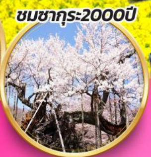
ชมซากุระ:2000ปี