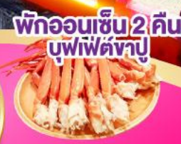
พิก่อนเริ่ม 2 คัน บุฟเฟ่ต์ซาปู