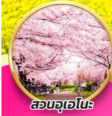
สวนอุเอโนะ