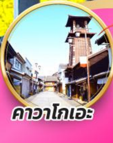
คาวาโกเอะ