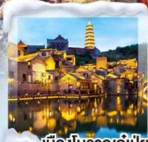
เมืองโบราณกุ๋มเป่ย์