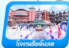
โรงงานช็อคโกแลต

สายการบิน AirAsia X (XJ) น้ำหนักกระเป๋า 20 KG