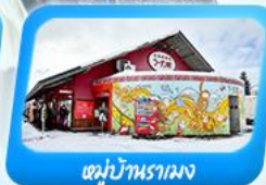
หมู่บ้านรามวง