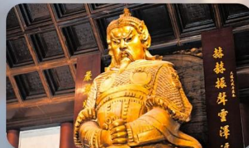
วัดเซ่งกง