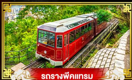
รถรางพิกแรม