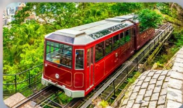
รถรางพิกแตรม